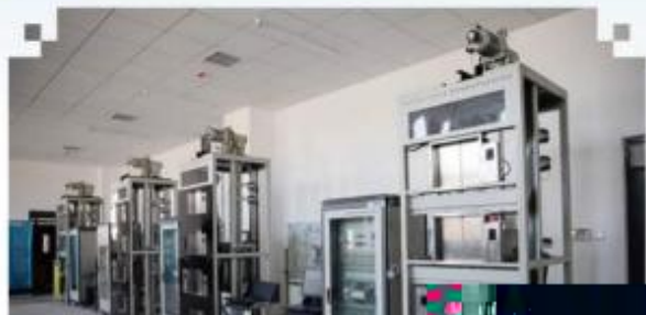
自动化生产线安装与调试训练场所